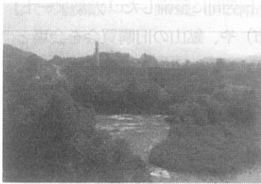
図-2 旧北炭清水沢火力発電所

旧北炭清水沢火力発電所（以下旧発電所）は、1926(大正15)年に完成した北炭(北海道炭礦汽船株式会社)の発電所である。昭和30年代前半には最大出力74,500キロワット、認可容量49,500キロワットを誇り、わが国有数の自家発電所と言われ、100kmにわたる送電線網を形成した。戦後復興期の北電への電力供給や、坑内ガスの有効利用・微粉炭助燃装置の設置などによる発電効率向上で産業界へ大きな足跡を残し、1991(平成3)年に廃止された。