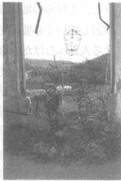
図-3 作品「窓際にもういない人」

壊れて大きな穴が開いていた窓に、ワイヤーで作った炭鉱マンの像を配置した。実体の無い彼の身体の向こう側に清水沢ダムや旧清水沢炭鉱が透けて見える。それを見て「自らが日本の産業発展を牽引してきたという誇りを胸に秘めているように見える」という解釈もあれば、「坑内災害で逃げる間もなく亡くなった人のように見える」という見方もあった。作品がそこにあることで、壊れた窓だけでは表現できない炭鉱の記憶に思いを寄せることが可能になる。